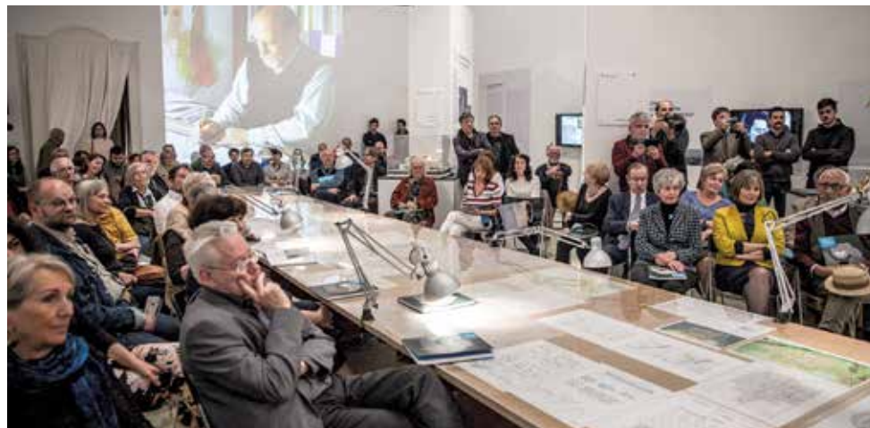
BESZÉLGETÉS A MISKOLCI MŰHELYRŐL A MŰCSARNOK KIÁLLÍTÁSÁN. FOTÓ: MŰCSARNOK

Bodonyi Csaba építészete MMA kiadó, 2019, 208 oldal